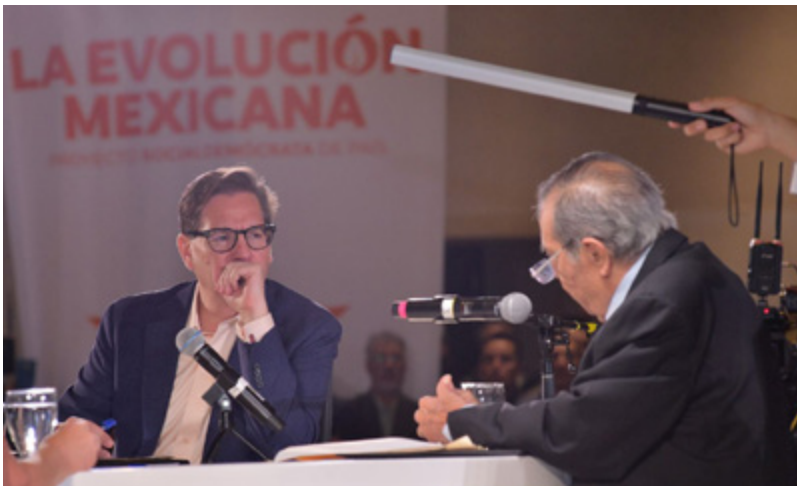
Salomón Chertorivski Woldenberg Consejo Consultivo Pensando en México