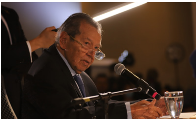
Porfirio Muñoz Ledo y Lazo de la Vega

Ciudad de México 24 y 25 de octubre 2022