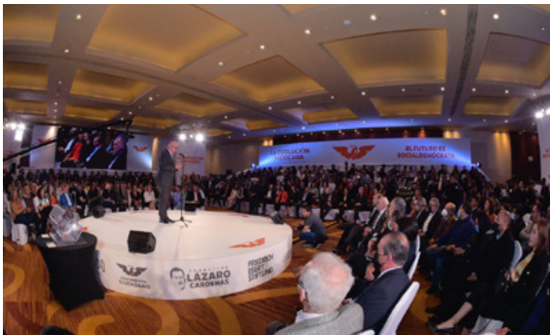
Dante Delgado Coordinador de la Comisión Operativa Nacional de Movimiento Ciudadano -México