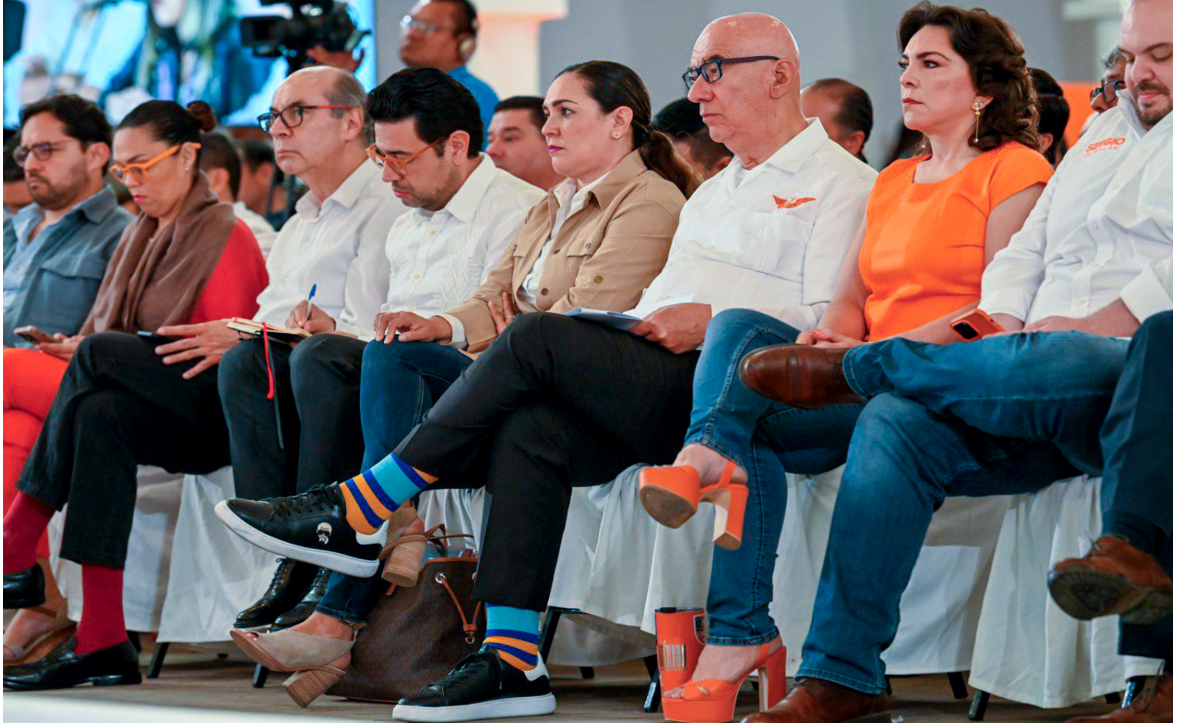
• Dirigentes de Movimiento Ciudadano durante el seminario Seguridad, justicia y paz.