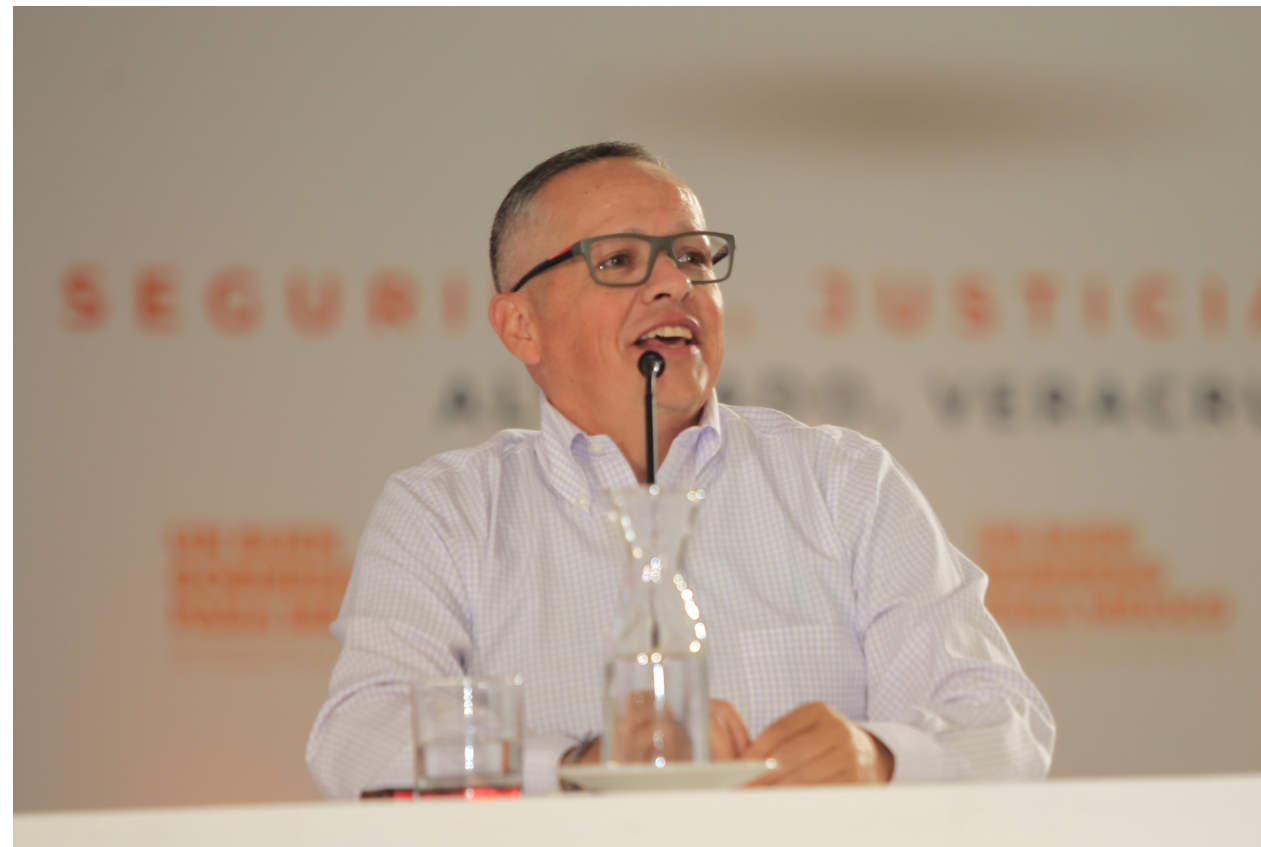
• Mtro. Miguel Garza Flores , director ejecutivo del Instituto para la Seguridad y la Democracia (Insyde), durante su participación en el seminario “Seguridad, justicia y paz”.

Esas contrahechuras no se resuelven poniendo más botas en el terreno ni cediendo a los militares la conducción de la seguridad pública. De hecho, en muchos sentidos, la ruta militar agrava el problema: limita la transparencia y la rendición de cuentas, agudiza el problema de distribución de competencias y exacerba las tendencias punitivas del sistema.