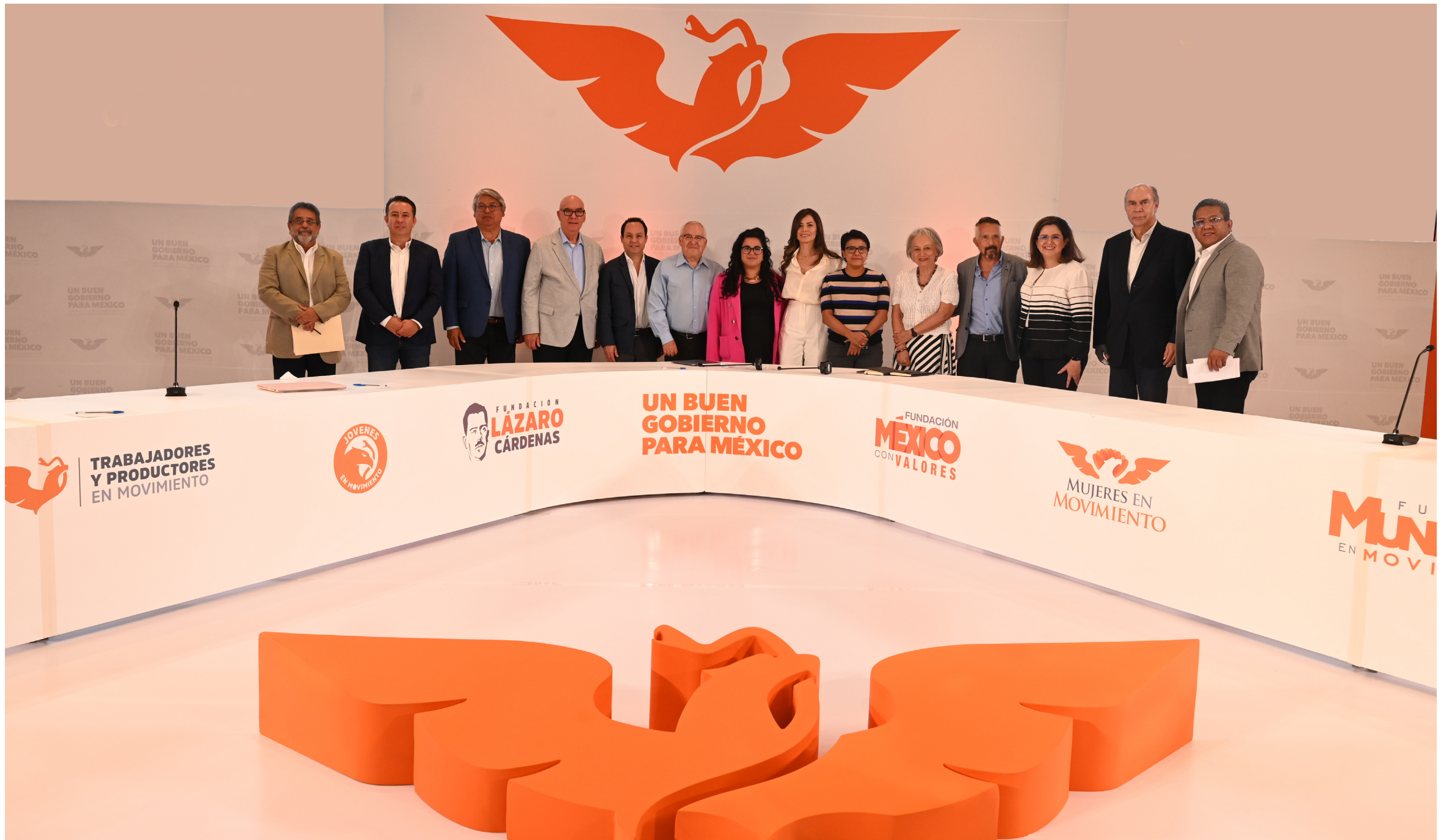
• Foto general de las y los panelistas durante el seminario “Innovación, ciencia y tecnología”.