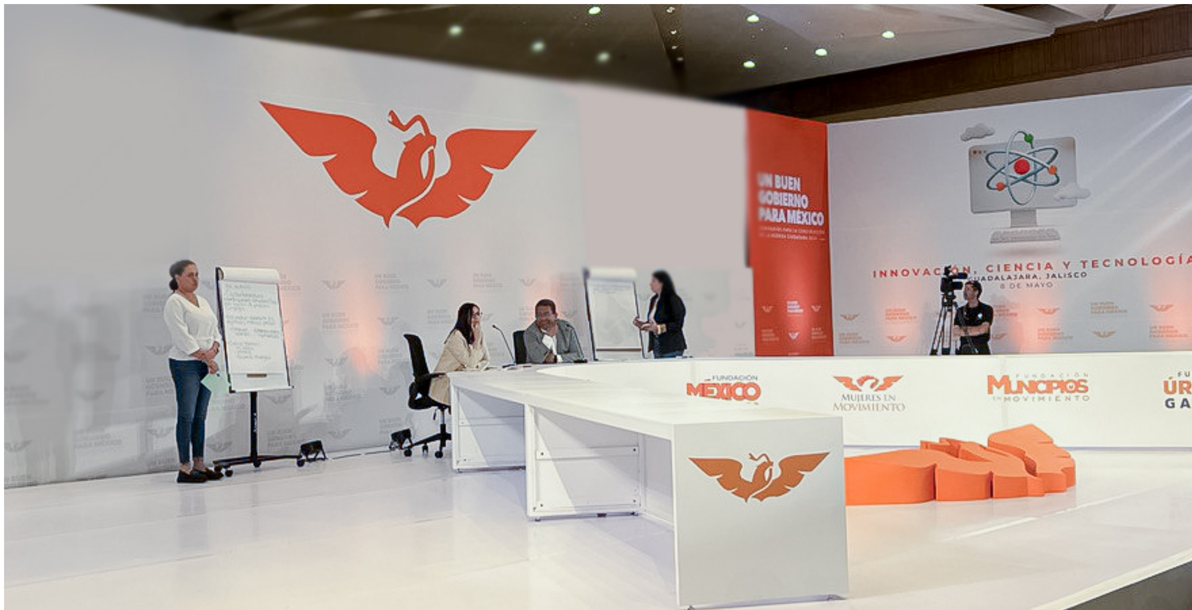
• Foto general del taller Innovación, ciencia y tecnología.