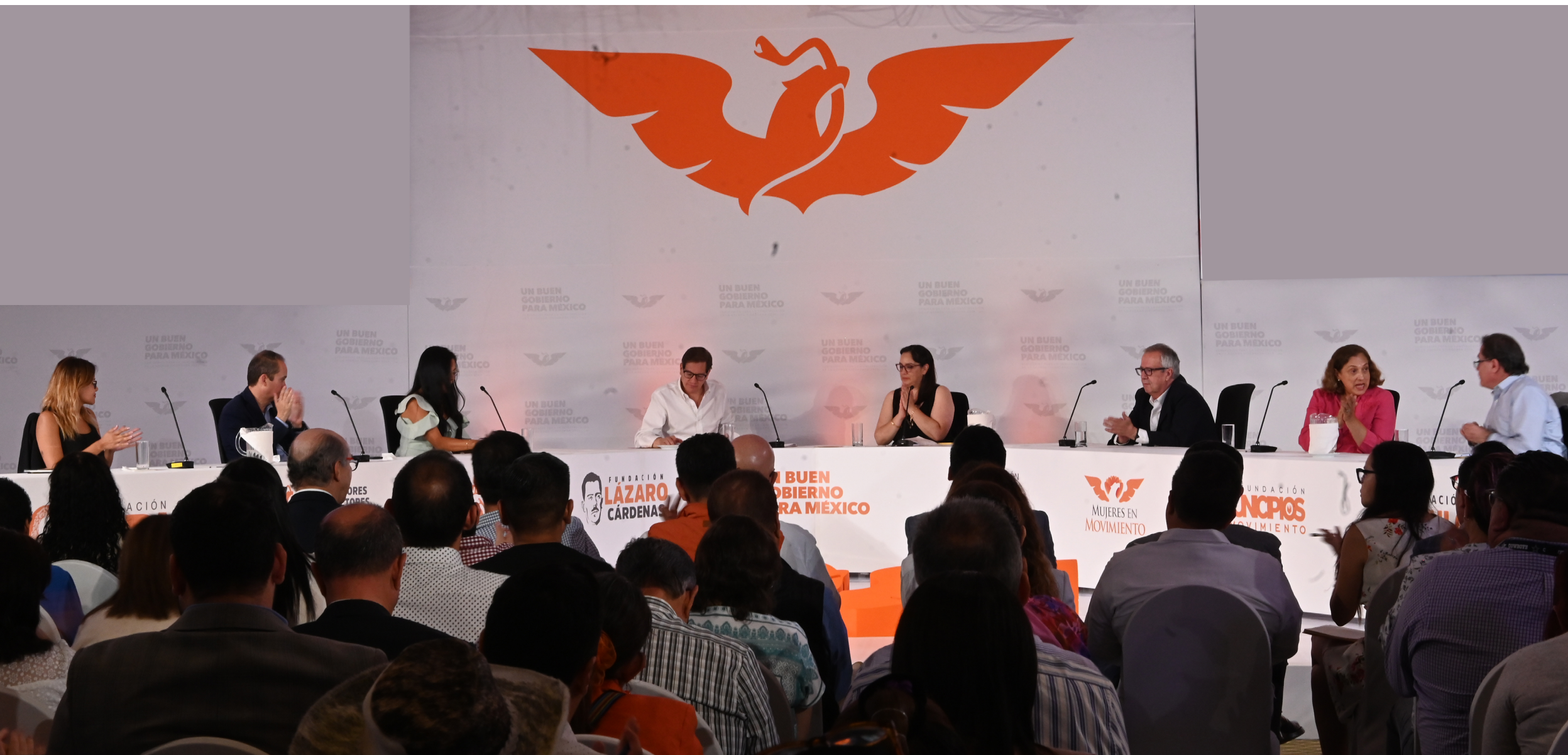
• Fotografía general de las y los panelistas durante el décimo Seminario: Hacienda pública y reforma fiscal.